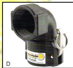
D Codo Acople Hembra - Rosca Hembra