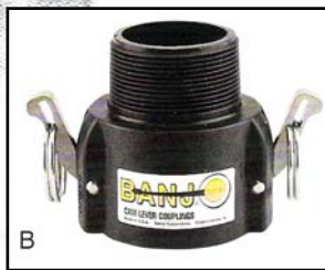
B Acople Hembra-Rosca Macho