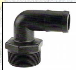
Codo Rosca Macho - Espiga para manguera