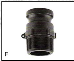
F Adaptador Macho-Rosca Macho