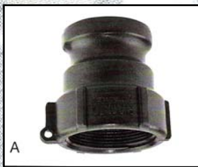
A Adaptador Macho-Rosca Hembra