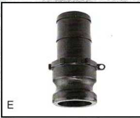
E Adaptador Macho- Espiga para manguera