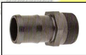
Rosca Macho- Espiga para manguera