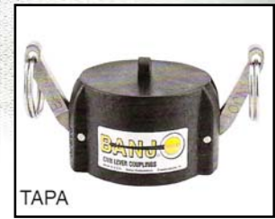
TAPA Tapón para adaptador Macho