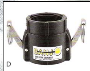
D Acople Hembra-Rosca Hembra