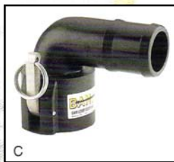
C Codo Acople Hembra - Espiga