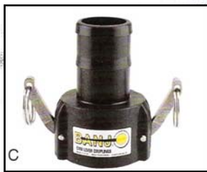
C Acople Hembra-Espiga para manguera