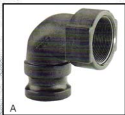
A Codo Acople Macho - Rosca Hembra