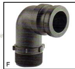
F Codo Acople Macho - Rosca Macho